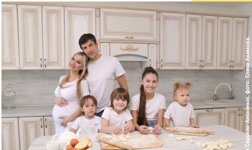
Семья Сероких-Анохиных, фото: Елена Акимова

СОХРАНЕНИЕ ОБЩЕИЗВЕСТНЫХ И СОЗДАНИЕ НОВЫХ ТРАДИЦИЙ В МОЛОДЫХ СЕМЬЯХ