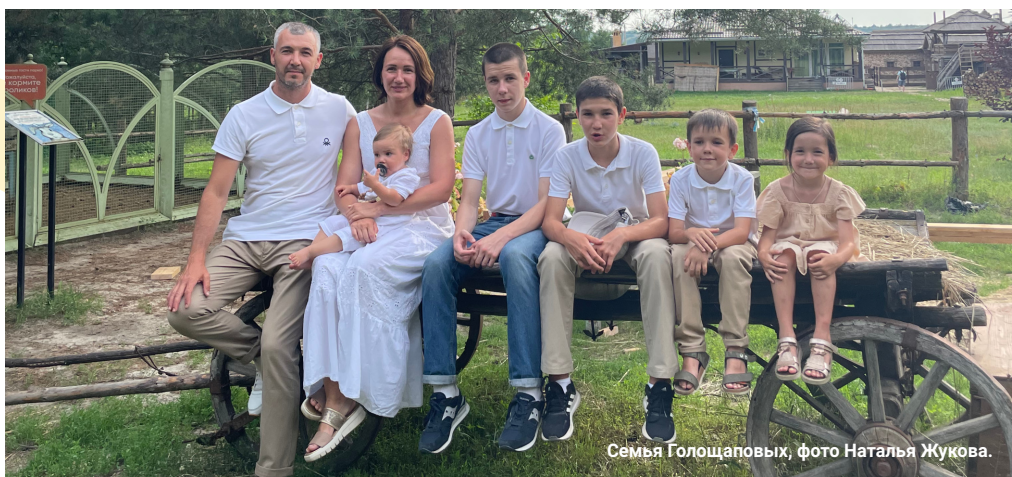
Семья Голощаповых, фото Наталья Жукова.