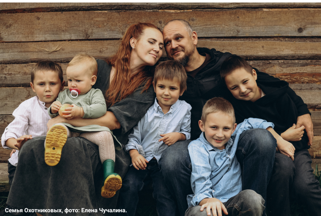
Семья Охотниковых, фото: Елена Чучалина.